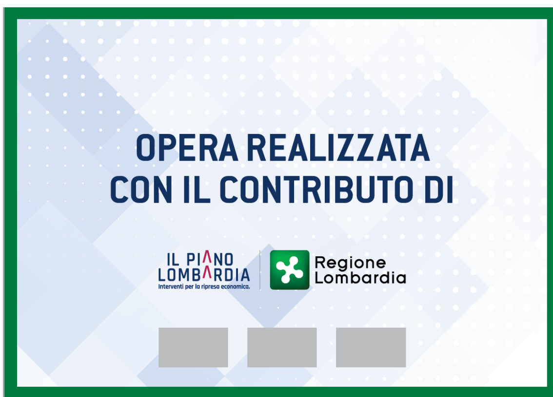
MODELLO DI TARGA IN CASO DI PARTNER